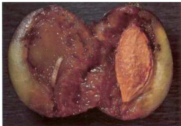
Wer kennt sie nicht, die Pflaumenwicklermade in der Frucht

Anfang Oktober kann die Wellpappe zusammen mit Raupen und Puppen entfernt und vernichtet werden.