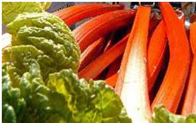
Die saftigen, essbaren Blattstiele des Rhabarbers

Ab Juli muss die Pflanze noch Kraft für das nächste Jahr sammeln können. Kräftige Pflanzen kann man mehrmals ernten, und zwar nimmt man die drei bis vier kräftigsten Stängel. Aber unbedingt jedes Mal zwei Drittel der Blätter stehen lassen und zwischen den Ernten zwei bis drei Wochen Zeit lassen. Blütentriebe möglichst sofort entfernen., weil sie Kraft verbrauchen – auf Kosten der Blätter. Übrigens: die Blütenknospen sollen eine leckere Zutat zum Salat sein. Die Blattstiele werden mit einem leichten Ruck herausgedreht, nicht abgeschnitten. Gleich nach der Ernte wird gedüngt. Ein paar Hand voll halbreifen Kompost oder organischen Volldünger leicht eingeharkt und bei Trockenheit gut gießen – dann gibt es auch im nächsten Jahr wieder dicke Stiele.